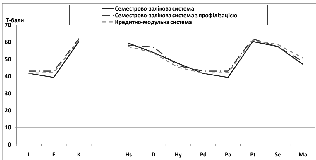
Рис. 1. Усереднений особистісний профіль дівчат, що перебували в умовах різних систем організації навчального процесу

Достатньо типова, як і для більшості характерологічних властивостей, що оцінювались, картина спостерігалась і в ході визначення структурних особливостей досліджуваних показників – переважною слід було вважати питому вагу середньонормативних показників, частка яких серед дівчат і юнаків, які навчались за СЗС, складала 66,2% і 64,4%, серед дівчат і юнаків, які навчались за СЗСП, – відповідно, 74,7% і 74,3%, серед дівчат і юнаків, які навчались за КМС, – відповідно, 80,3% і 75,0%.