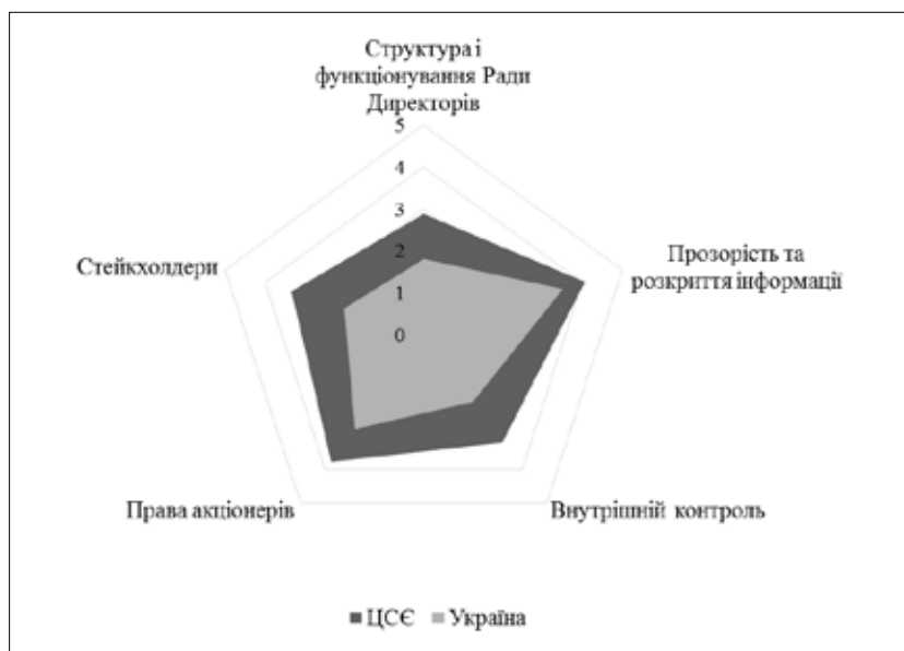
Рис. 2. Стан корпоративного управління в країнах ЦСЄ станом на 2017 рік

Незважаючи на те, що процеси імплементації та реформи корпоративного управління в країнах із перехідною економікою почалися значно раніше, рівня розвинутих країн не було досягнуто, особливо в питаннях