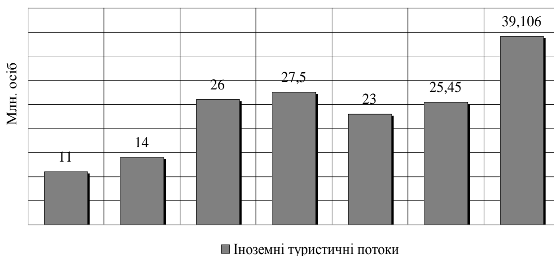
Рис. 2 Динаміка міжнародних туристичних потоків в Україну