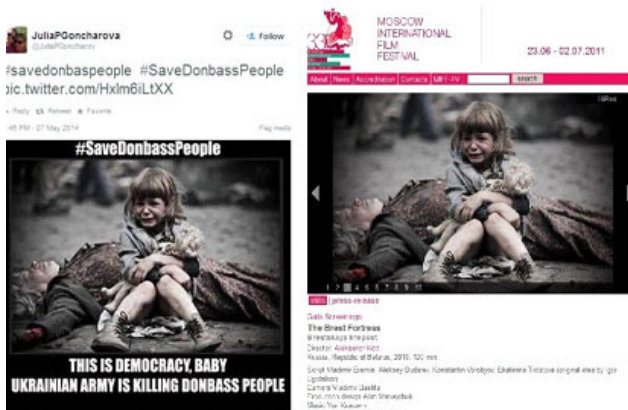
Рис. 1. Користувачі мереж активно поширюють фото маленької дівчинки біля вбитої жінки, описуючи його як фото подій в Донбасі. Але насправді це кадр з російсько-білоруської стрічки 2010 року «Брестська фортеця»

Для здійснення психологічного терору російською пропагандою використовуються не лише друковані ЗМІ та мережі ефірних й кабельних мас-медіа, але й Інтернет, електронні пошти тощо. Після війни Росії з Грузією 2008 року уряд Росії усвідомив, наскільки важливо управляти думками в Інтернеті, в тому числі на міжнародному рівні. Останнім часом для зомбування або навіщування ярликів активно почали використовуватися соціальні мережі. Найчастіше беруться одіозні, криваві та емоційні знімки з інших країн та подій і видаються за українські (рис 1,2.)