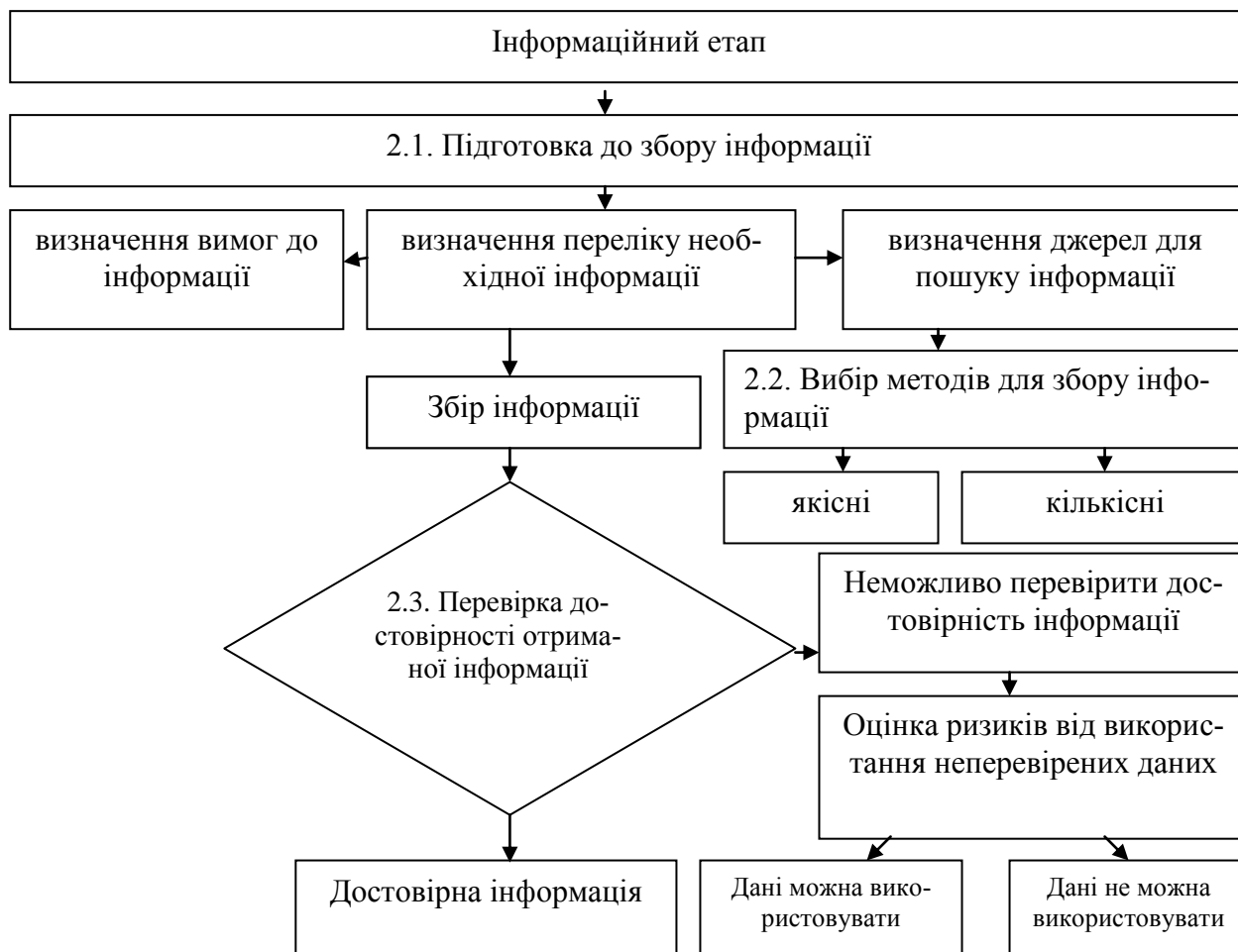
Рис. 2. Схема проведення інформаційного етапу*

* Розроблено авторами на основі [2, 4, 8]