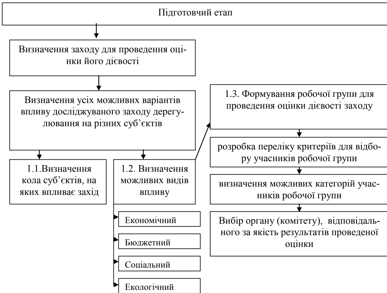
Рис. 1. Схема проведення підготовчого етапу *