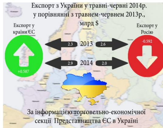
Рис.2. Експорт із України у травні–червні 2014 р. у порівнянні з травнем–червнем 2013 р., млрд дол. США [ 7 ]

преференцій ЄС, у зв'язку з чим український експорт змінив свою спрямованість у бік Європи. У рамках тристоронньої угоди домовленості між Україною, ЄС і Росією Євросоюз зберіг для України односторонні преференції в торгівлі з країнами ЄС до кінця 2015 року. Це суттєво вплинуло на структуру зовнішньоторговельного балансу України, в якому збільшився обсяг експорту до країн ЄС на 25 %, що привело до зменшення експортної продукції у Росію на 25%. Істотно, що зростання українського експорту в Європу повністю компенсує втрати від зменшення експорту в Росію за цей же період (-24,5% за останні 6 міс. 2014 р.) (рис.2).