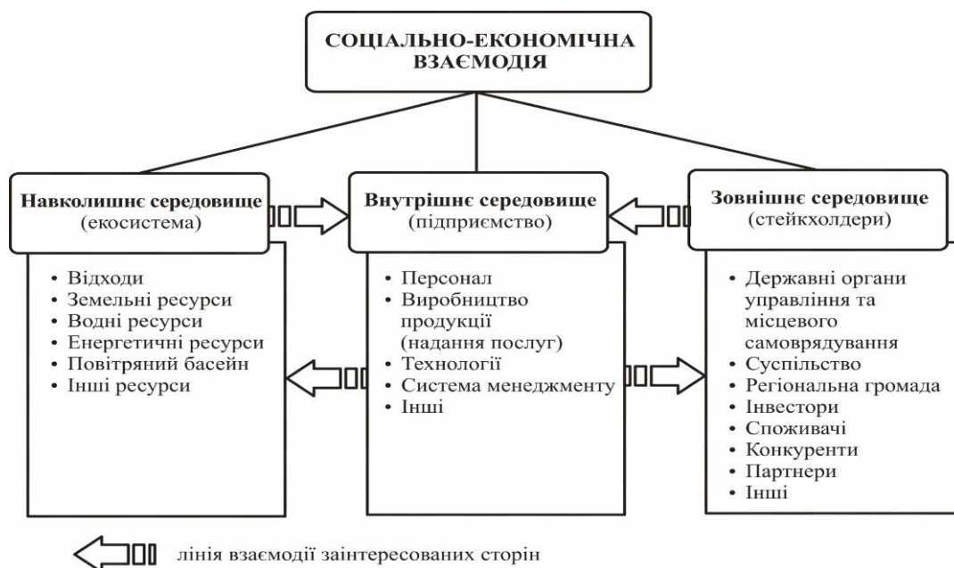
Рис. 2. Схематичне відображення процесу соціально-економічної взаємодії на підприємствах*

Схематично процес соціально-економічної взаємодії підприємства із середовищем функціонування відображено на рис. 2.