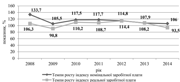
Рис. 2. Темпи зростання індексів номінальної та реальної заробітної плати в Україні за 2008–2014 рр., %

вважається та сума грошей, що отримує працівник за час своєї роботи, виконані послуги; а реальною – скільки працівник може витратити, тобто що він зможе купити за отриману номінальну заробітну плату. Порівняємо темпи росту номінальної та реальної заробітної плати (рис. 2).