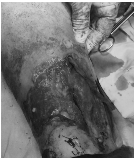
Рис. 1. Трофічна виразка до аутодермопластики

Після стандартної передопераційної підготовки хворій було виконано одномоментні флебектомію за Беккоком-Наратом-Кокетом та вільну аутодермопластику. Шкірний аутодемотрансплантат брали із передньо-латеральної поверхні правого стегна. Післяопераційний період без ускладнень, через 15 днів після операції хвора була виписана зі стаціонару (рис. 2). Повне загоєння трофічної виразки відзначено на 36 день після операції. У віддаленому післяопераційному періоді (час спостереження за пацієнткою склав 2 роки) рецидиву варикозної хвороби та трофічних виразок на оперованій нижній кінцівці не виявлено. Пацієнтка повернулась до повноцінної праці.