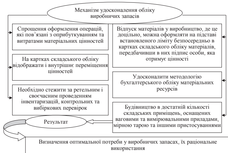
Рис. 2. Економічний механізм удосконалення обліку виробничих запасів

Значно поліпшити організацію обліку виробничих запасів можна, удосконалюючи процес документування, тобто ширше використовуючи накопичувальні документи (лімітно-забірні картки, відомості тощо), картки складського обліку як витратний документ по відпущених матеріалах (бездокументальну систему оформлення витрат матеріалів).