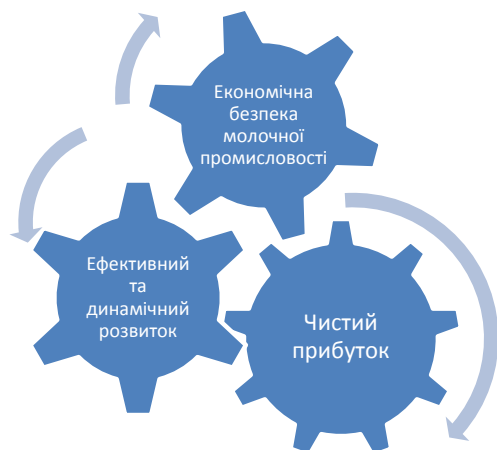
Рис. 1. Взаємозв'язок між чистим прибутком і економічною безпекою молочної промисловості

Таким чином, між чистим прибутком і економічною безпекою існує взаємозв'язок (див. рис. 1), оскільки для того щоб досягти економічної безпеки молочної промисловості, необхідна наявність чистого прибутку, а для того щоб забезпечити отримання чистого прибутку, необхідно забезпечити безпеку кожної складової системи й економічної безпеки в цілому [3, с. 97-98; 4, с. 35-37].