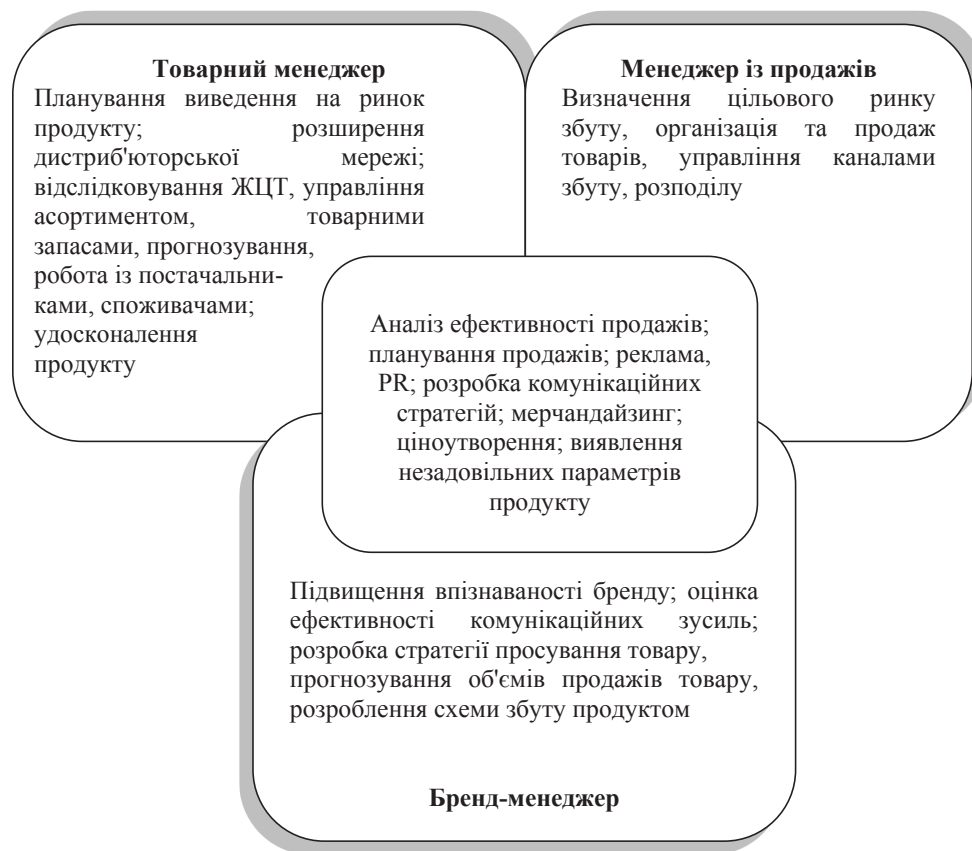
Рис. 2. Спектр функціональних обов'язків менеджерів у сфері управління товаром