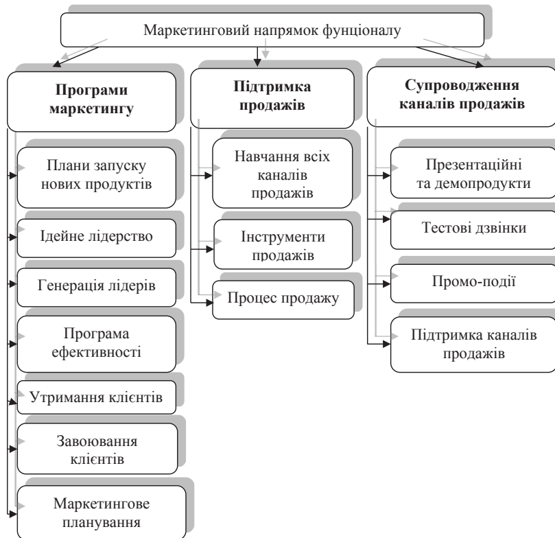
Рис. 4. Маркетинговий напрямок функціональних обов'язків товарного менеджера