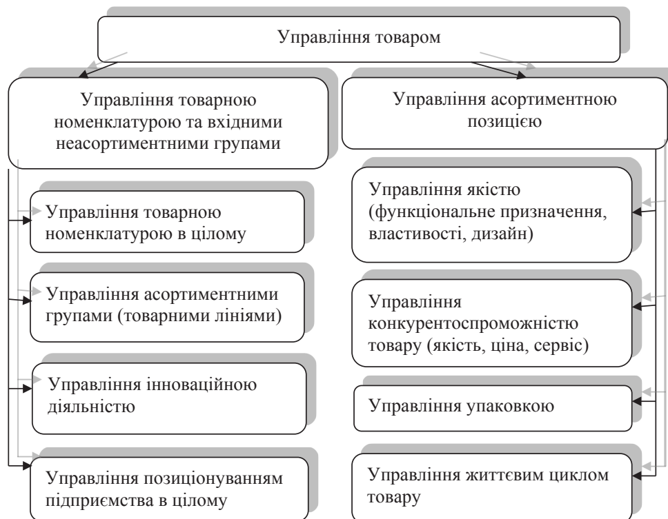
Рис. 1. Складові товарного управління