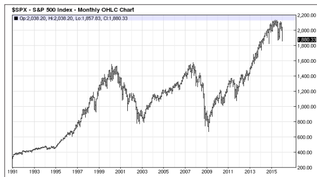
Рис. 2. Исторические значения индекса фондового рынка США Standard & Poor's – 500 за период с 1991 по 15 января 2016 г.