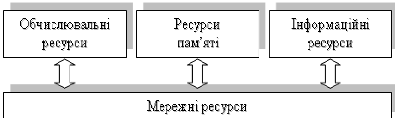
Рис. 1.2. – Ресурси GRID

Базовий рівень (Fabric Layer) архітектури GRID описує служби, що безпосередньо працюють з ресурсами. Ресурс є одним з основних понять архітектури GRID. Можна виділити декілька основних типів ресурсів (рис.1.2):