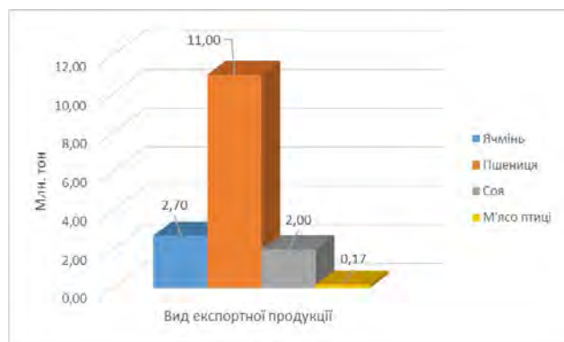
Рис. 2. Основні експортні показники АПК станом на вересень 2016 року [2]

Ключові показники позитивного зростання ефективності діяльності підприємств АПК в напрямі експортних поставок наведено в інфографіці (рис. 2).