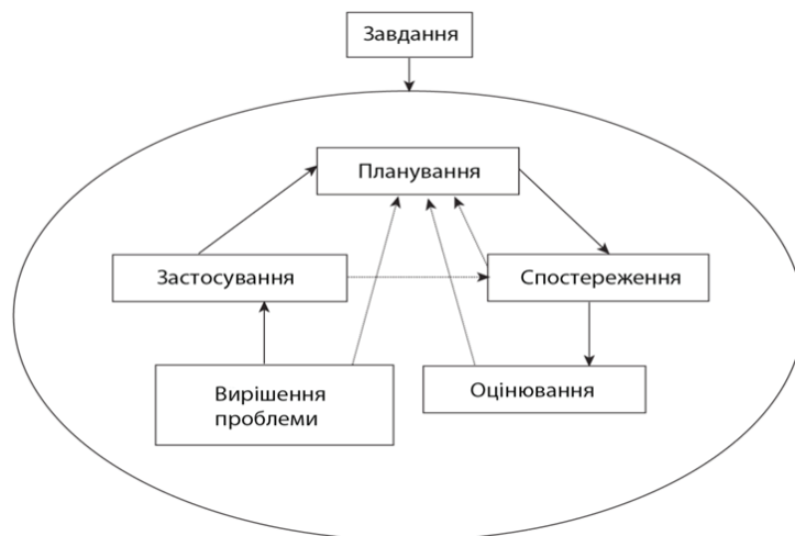
Рисунок 1. Етапи виконання завдання (самоуправління студента).

Самоуправління студента включає наступні етапи виконання завдання: планування, спостереження (моніторинг), оцінювання, вирішення проблеми і застосування (реалізація) [6, с.37] (рисунок 1).