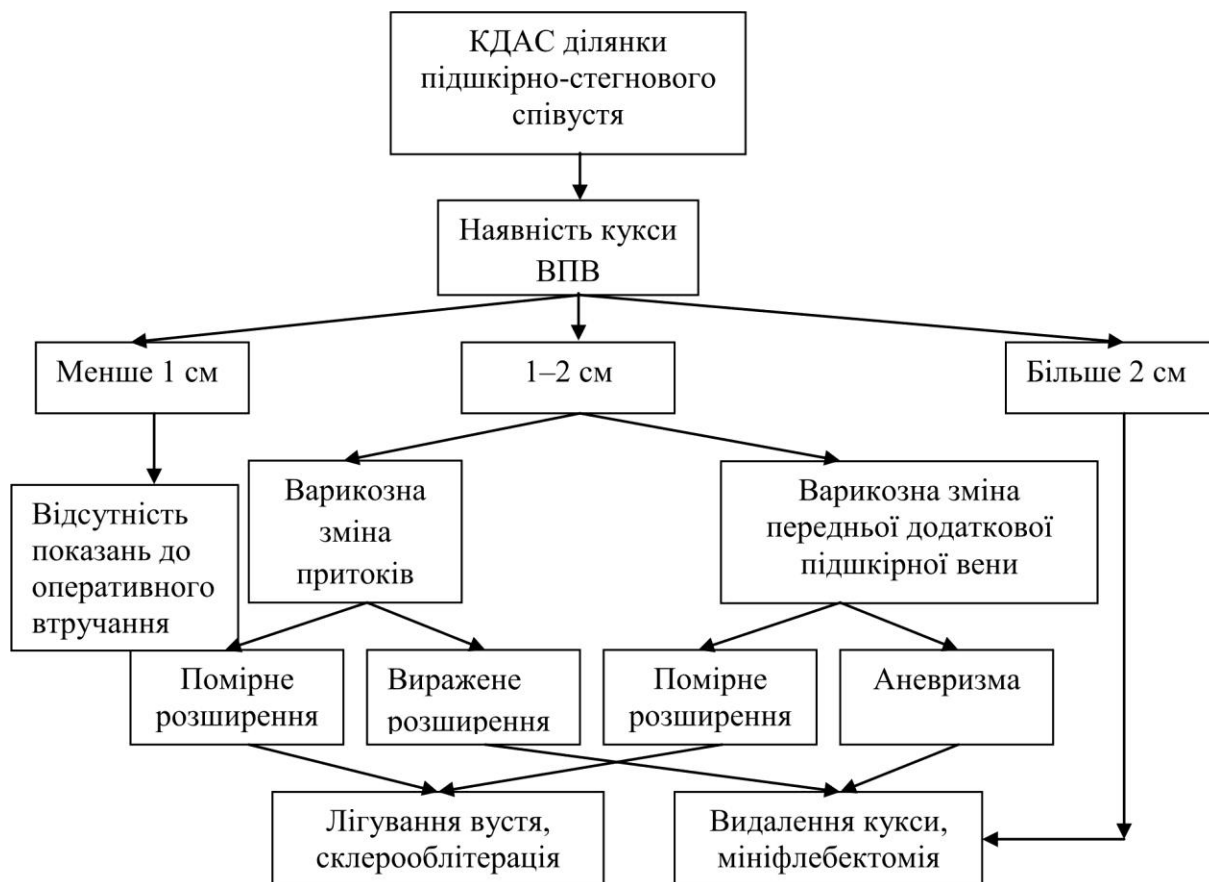
Рис. 1. Алгоритм лікування хворих із РВХ при наявності патологічної кукси ВПВ.

пеня варикозної трансформації її притоків (рис. 1). При довжині кукси менше 1,0 см від ревізії підшкірно-стегнового співустя (ПСС) утримувалися через залучення в рубцевий процес стегнової вени і високого ризику її пошкодження під час виділення. У такій ситуації у 4 (18,18%) хворих була збережена тільки верхня притока ВПВ – поверхнева надчеревна вена, клінічних ознак РВХ на стегні виявлено не було, що і служило причиною відмови від хірургічного втручання у зазначеній ділянці.