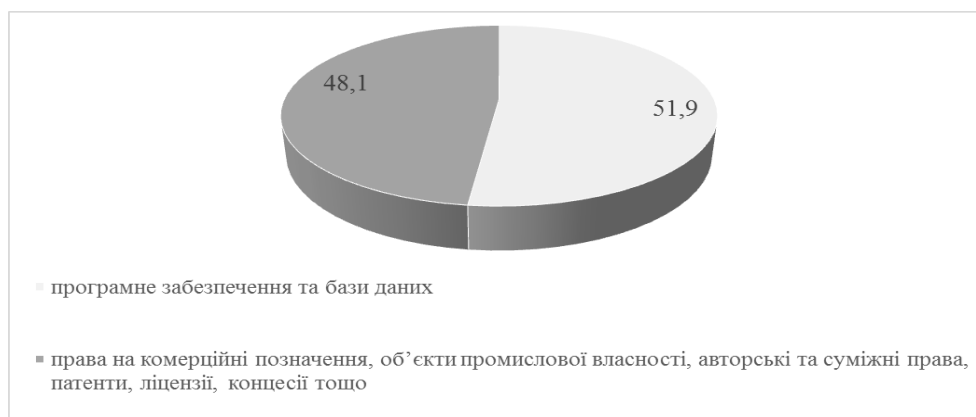
Рис. 3 Структура капітальних інвестицій у нематеріальних активах у 2014 р., % [7]

Це відповідає сучасним тенденціям вітчизняної економіки, в якій спостерігається зростання значення напрямів розвитку програмного забезпечення та бази даних.