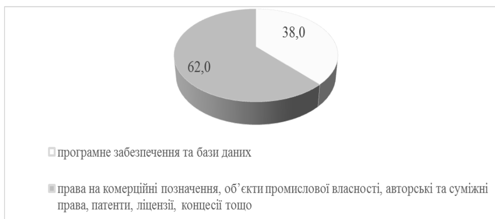
Рис. 2 Структура капітальних інвестицій у елементи нематеріальних активів у 2013 р. [7]

У структурі капітальних інвестицій у елементи нематеріальних активів (рис. 2 – 4) найбільшу питому вагу у 2013 р. складають права на комерційні позначення, об'єкти промислової власності, авторські та суміжні права, патенти, ліцензії, концесії тощо (62%), програмне забезпечення та бази даних займають 38% (рис. 2).