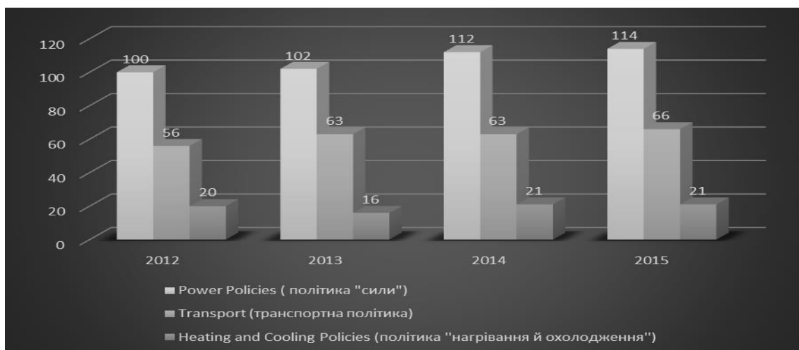
Рис. 2. Дані щодо застосування різних типів політики використання відновлюваних джерел енергії у світі, період 2012-2015 років*

напрямку дають досить серйозні результати (див. рис. 2.).