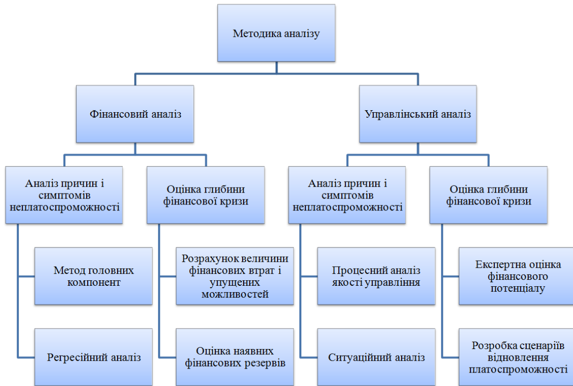
Рис. 2. Вибір методу оцінки стану платоспроможності підприємства*