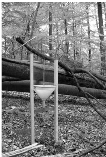
Рис. 2 Комбінована пастка