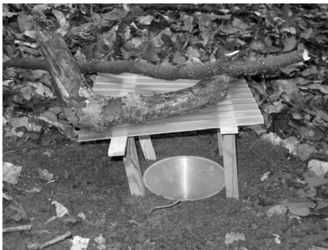
Рис. 3 Ґрунтова пастка