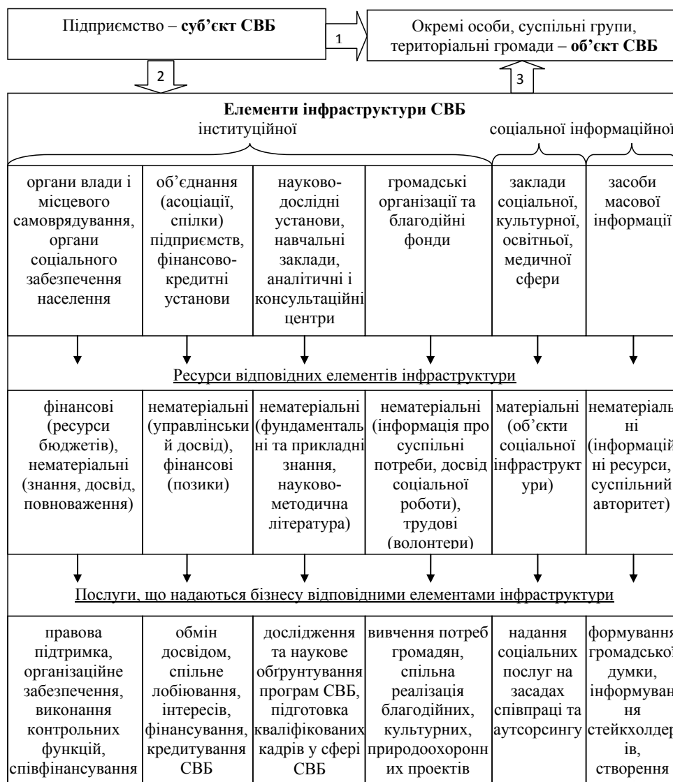
Рис. 2. Система інфраструктурного забезпечення СВБ

Примітка: 1 – прямий вплив бізнесу на суспільство; 2 – взаємодія бізнесу з елементами інфраструктури СВБ; 3 – надання елементами інфраструктури СВБ соціальних послуг громадянам за рахунок використання ресурсів бізнесу