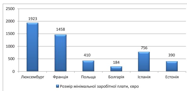
Рис. 1. Розмір мінімальної заробітної плати у країнах-членах ЄС у 2016 році, євро

Як видно з таблиці 1, у 2016 році найвищий рівень безробіття був в Іспанії, Португалії, Кіпрі, Греції та Хорватії, а найнижчий рівень безробіття – в Чехії та Німеччині. Також аналіз даних, наведених у таблиці, показує позитивну тенденцію скорочення рівня безробіття майже в усіх країнах ЄС, крім Австрії, протягом 2011–2016 рр.