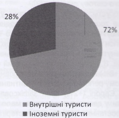
Рис. 4. Частка внутрішніх та іноземних туристів у внесках до світового ВВП, % (2016) [10]

На рисунку 4 розглянемо частку внутрішніх та іноземних туристів у внесках до світового ВВП.