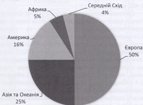
Рис. 1. Регіональні туристичні потоки у 2016 році [8]

За даними організації UNWTO туристичні потоки між регіонами розподілися досить нерівномірно (рис. 1).