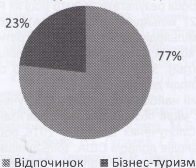
Рис. 3. Внесок туристичної галузі до світового ВВП за такими складовими, як бізнес-туризм та туризм з метою відпочинку, % (2016) [10]

На рисунку 3 зображено внесок туристичної галузі до світового ВВП за такими складовими, як бізнес-туризм та туризм з метою відпочинку.