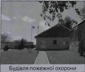
Будівля пожежної охорони

1923–30 – село Харків. округи, від 1932 – Харків. обл. Від 1923 до 1960-х рр. існував Липец. р-н, у якому 1926 проживали 31 484 особи. Жит. потерпали від голодомору 1932–33 (кількість встановлених жертв – 250 осіб), зазнали сталін. репресій.