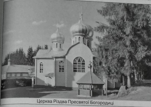
Церква Різдва Пресвятої Богородиці