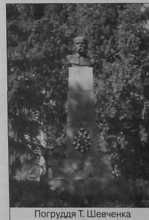
Погруддя Т. Шевченка

– село Шполянського району Черкаської області. Лип'ян. сільс. раді підпорядк. с. Межигірка. Знаходиться на р. Лип'янка (Гнилий Товмач ; бас. Південного Бугу ), за 100 км від обл. центру, за 25 км від райцентру та за 13 км