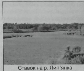
Ставок на р. Лип'янка

– річка у Шполянському районі Черкаської області, ліва притока Товмача (басейн Південного Бугу ). Довж. 30 км, пл. водозбір. бас. 169 км 2 . Бере початок на Зх. від с. Лебедин. Тече переважно в пд.-зх. напрямку. Впадає до Товмача в межах с. Ярославка. Долина трапезієподібна, завширшки до 2,5 км, завглибшки 40 м. Заплава завширшки до 100 м. Річище помірно зви-