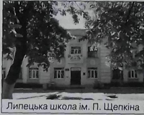
Липецька школа ім. П. Щепкіна

196 800 осіб. Від 2-ї пол. 17 ст. до 1765 – сотенне м-ко Харків. слобід. полку, 1765–80 – центр Липец. комісарства. У 18–19 ст. – казенна слобода. 1765–80 та 1796–1835 – у складі Слобід.-Укр., 1835–25 – Харків. губ.; 1780–96 – Харків. намісництва; 1780–1923 – Харків. губ. 1864 у Л. мешкали 3962 особи, налічувалося 1272 двори, діяли 3 православні церкви, уч-ще, відбувалося 6 ярмарків на рік. 1914 вже проживали 10 211 осіб. Під час воєн. дій наприкінці 1910-х рр. влада неодноразово змінювалася.