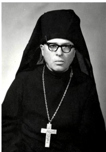
Ако vysvätený ihumen

в с. Доробратово. 10 вересня 1950 р. священник звернувся до Патріарха Московського Алексія з листом, у якому просив прийняти його слухачем Московської духовної академії. Однак прохання ієромонаха Іустина залишилося поза увагою 30 . До Різдва Христового 1951 р. з благословення єпископа Іларіона (Кочергіна) ієромонаха Іустина (Сідака) було нагороджено набедреником.