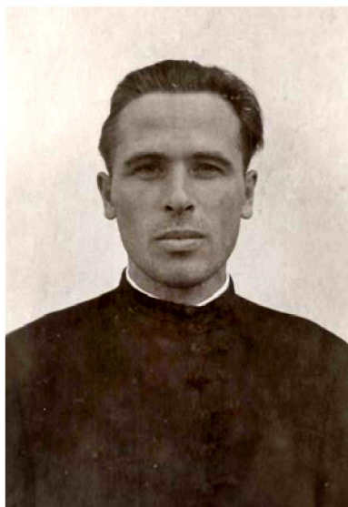
Po zložení mnišských sľubov

рені чоловічі і жіночі монастирі в Ізі, Липчі, Терелі. Після єпископа Досифея «Карпаторуською православною церквою» керували єпископ Новосадський Іриней (Чирич) 2 , Призренський Серафим (Йованович) 3 та Бітольський Йосип (Цвїювич) 4 .