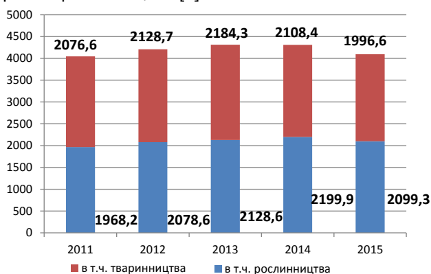
Рис. 1. Валова продукція сільського господарства Закарпатської області, у порівнянних цінах, млн. грн. [4]

Випуск продукції сільського господарства у Закарпатській області всіма сільгоспвиробниками (сільгосппідприємствами, господарствами населення, фермерами) у 2015 році склав 4095,9 млн. грн. (див. рис. 1). У 2015 році в сільському господарстві відбулося зменшення у порівнянні з 2014 роком на 4,9%, причому в рослинництві відбулось зменшення на 4,6%, а у тваринництві – на 5,3% [4].