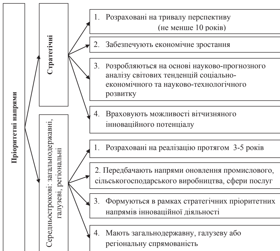
Рис. 1. Пріоритетні напрями розвитку галузі сільського господарства

використати виробничий сектор [8–10]. Висока продуктивність та рівень виробництва у сільському господарстві задушуть виробничий сектор, не змінюючи відносних цін.