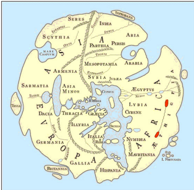
Рис. 2. Мапа Марка Віпсанія Агріппи (Dilke, 1998, p. 32).