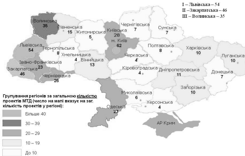
Рис. 3.2.2. Діючі проекти МТД протягом липня-грудня 2014 р. (кількість проектів)

Примітка: матеріали Міністерства економічного розвитку та торгівлі України.