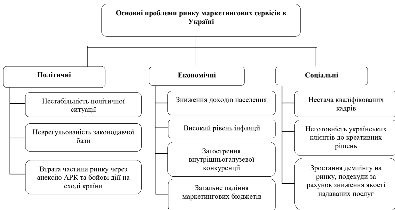
Рис. 3 Основні проблеми ринку маркетингових сервісів в Україні*

Однак за оцінками різних спеціалістів, для українського ринку маркетингових сервісів характерна низка проблем, а саме (рис.3):