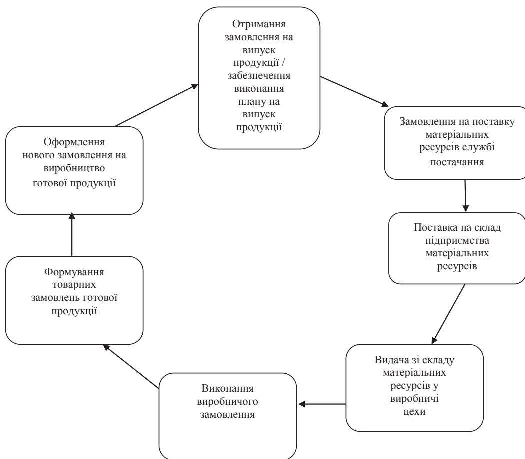
Рис. 2. Функціональний цикл інтралогістики [1, с. 196]