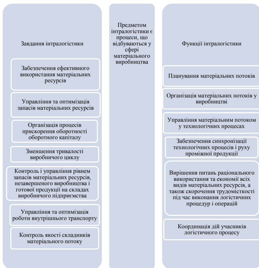
Рис. 1. Основні функції та завдання інтралогістики (власна розробка)

Функціональний цикл інтралогістики – це сукупність взаємопов'язаних і взаємозалежних процесів, що утворюють у цьому часовому періоді закін-