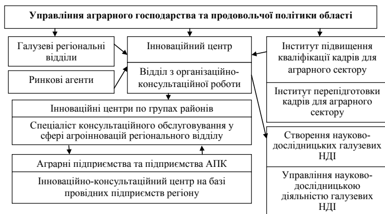
Рис. 3. Структура інформаційно-консультативних служб*