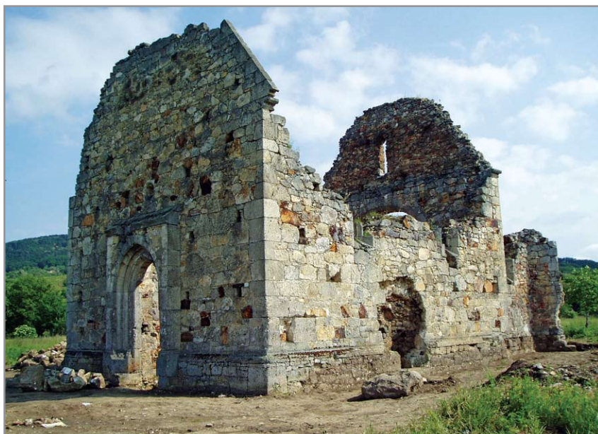
A templom romjainak látképe délről

Jelenleg a templom építésének és működésének időszakával kapcsolatos régészeti leletanyag keltezése a 15. század elejére – 17. század közepére tehető. Ugyanakkor, hogy több hiteles adatot gyűjtsünk össze, pontosabban meghatározhassuk a templom járószintjeit és kronológiáját, az Ungvári Nemzeti Egyetem régészexpedíciója a 2017-es idényben a műemlék további kutatását tervezi. ♡