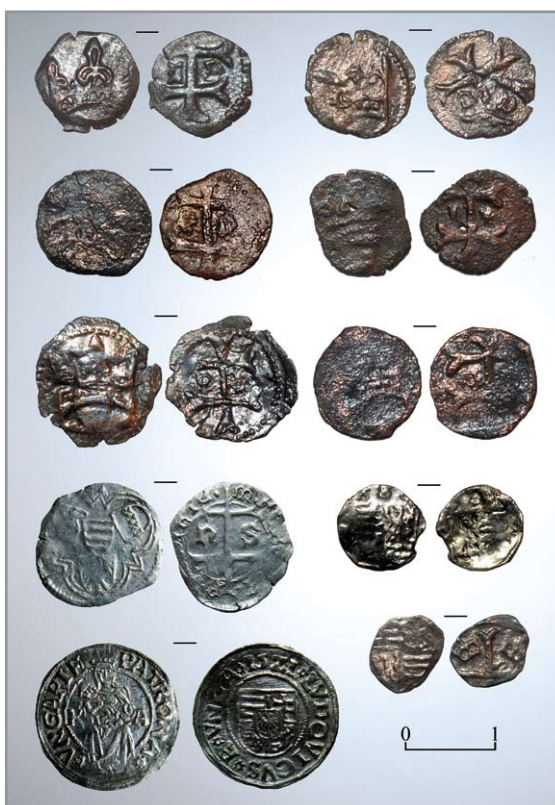
15–16. századi érmék