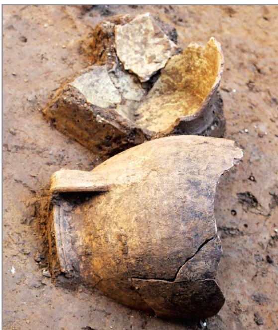
17. századi fazék töredékei