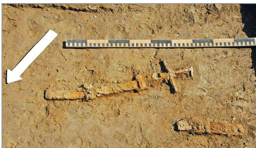
A törött szablya feltárás közben