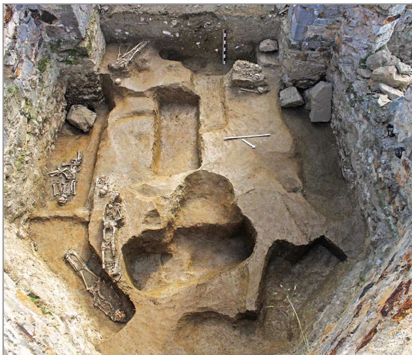
A szentély feltárása

támasztják, melyek felső része elpusztult. A szentély északi falához csatlakozik a sekrestye, falai a templom többi részéhez viszonyítva, a legrosszabb állapotban maradtak fenn.