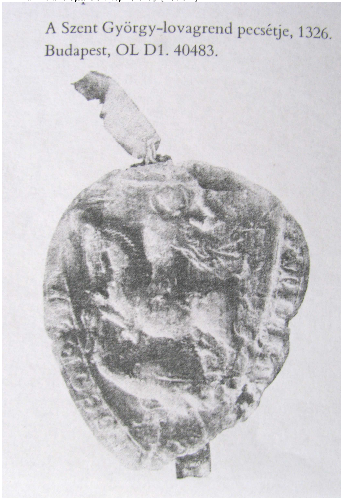
Рис. 1 Печатка Ордену Св.Георгія, 1326 р. [21, с. 312]