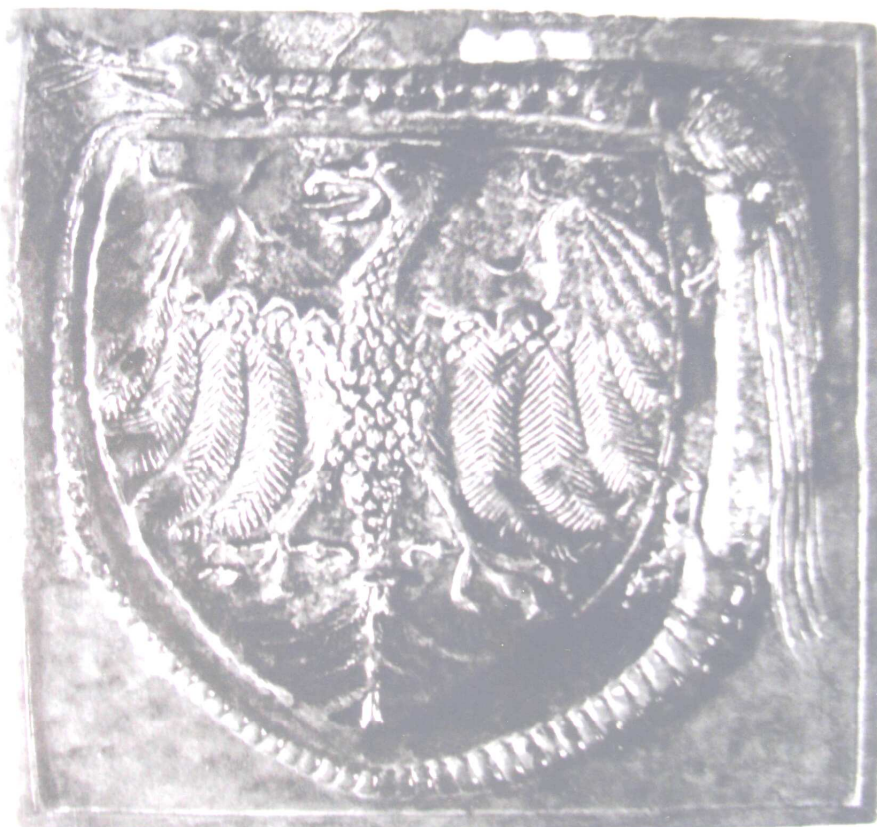
Рис. 8 Невизначений герб, можливо належної до родини Аба сім'ї Комполті [18]