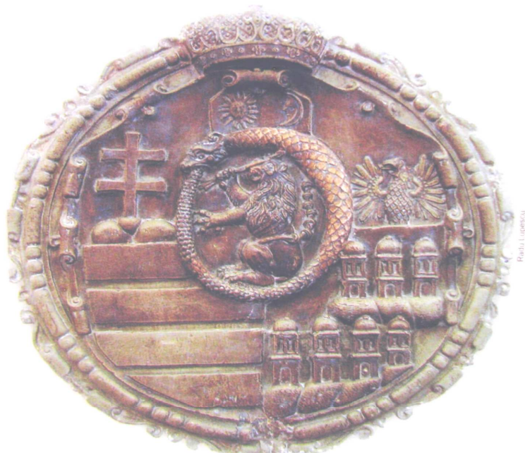
Bocskai szülőháza helyén ma az Erdélyi Magyar Tudományegyetem épülete áll, földszinti termének falán a fejedelem 1606-ban készített, a Bocskai család, Erdély és Magyarország egyesített címerét ábrázoló dombormű látható

Erzsébet nevű nővére a fejedelem testvérének, Báthory Kristóf vajdának felesége volt, ezért kapott fontos szerepet a vajda fia, a leendő fejedelem, Báthory Zsigmond nevelésében. Báthory Kristóf halála után Zsigmond gyámja lett és az Erdélyt kormányzó testület tagja. Báthory István megbízta a főkomorníkot tisztevel, vagyis Bocskai volt a felelős a fejede-