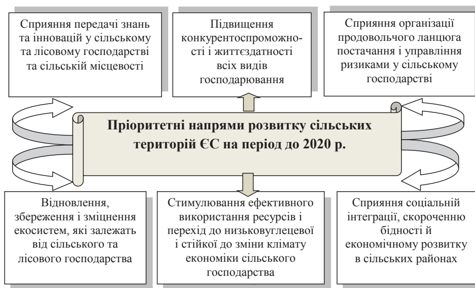
Рис. 3. Стратегічні напрями політики сільського розвитку ЄС у 2014–2020 рр.

Висновки. Узагальнення вищевказаного, свідчить про те, що трансформаційні перетворення, які відбувалися в Україні останні 30 років, справили значний вплив на розвиток українського села. Тому дієвий організаційно-економічний механізм реалізації стратегії сталого розвитку сільських територій має забезпечити: соціально-демографічну стабілізацію на селі; належний рівень економічно-виробничого розвитку; розвиток інститутів місцевого самоврядування; впровадження програм сталого сільського розвитку; інвестиційну привабливість сільської місцевості, а також формування такої соціальної інфраструктури села, яка би покращила умови праці і рівень життя на селі.