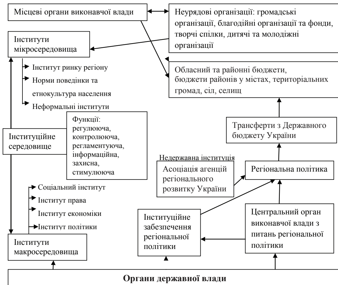
Рис. 2. Концептуальна схема інституційного середовища регіону

зумовлює потребу в побудові концептуальної схеми інституційного середовища регіону (рис. 2.).