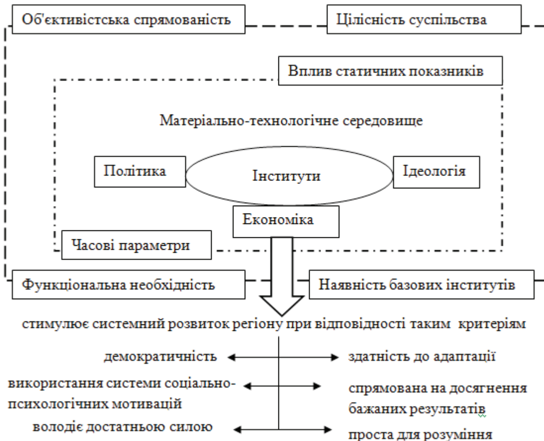
Рис. 4. Схематичне зображення інституційної матриці регіону

Примітка: розроблено автором на основі [7, с. 45-74; 5, с. 268].