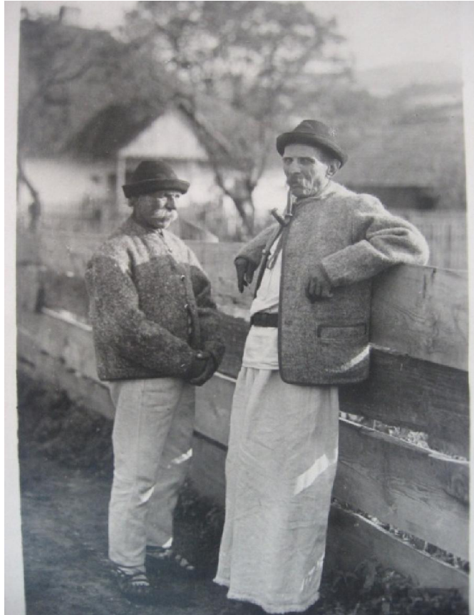
Рис. 5. Чоловіки у народному вбранні, с. Люта Великоберезнянського району. 20-40-і рр. XX ст.

Своєрідністю відзначалися обрядові головні убори, зокрема весільні. Шапка молодого завжди відрізнялася від головних уборів інших хлопців прикріпленням до неї знаком-атрибутом у вигляді прикрас («фарговів») із пір'я та квітів. Знак-квітку пришивали молодому до шапки тоді, коли він ішов брати шлюб. На Бойківщині весільним знаком молодого та молодої був вінок. На капелюх молодого прикріплювали вінок, виготовлений із барвінку, квітів, стрічок, пір'я тощо. На Закарпатті вінок, як відзнака наречених, побутував до середини XX ст., а в деяких місцевостях побутує й нині [25, с. 17-19].