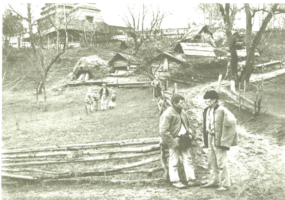
Рис. 2. Село Стужиця Великоберезнянського району. 30-і рр. XX ст.