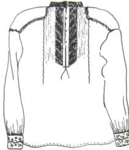
Рис. 3. Крій чоловічої сорочки, с. Гукливе Воловецького району. 20-30-і рр. XX ст. (Рисунок О. В. Полянської)

З перших десятиріч XX ст. у бойків Закарпаття поширилися чоловічі сорочки з яскравою поліхромною вишивкою. Кроїли їх із двох пілок, зшитих по боках до місця вставлення довгих рукавів. Зустрічалися як сорочки з «плечиками», так і без них. Вишивкою геометричних чи геометризвано-рослинних мотивів оздоблювали комір, розріз пазухи та пришивні манжети. У бойківських селах Закарпаття поширеними були кілька варіантів орнаментальних композицій вишивки. У селах Пилипець, Ізки, Подобовець Міжгірського району поширеними були орнаментальні композиції з ромбів, на стику яких формувалися два рядки трикутників. Допоміжними мотивами були скісні хрести, дрібні ромбики та меандрові лінії. У селах Абранка, Підполоззя, Задільське, Жденієво, Щербовець Воловецького району переважали вузькі орнаментальні смуги, на чорному фоні яких вишивали геометризовані квітки і листочки.