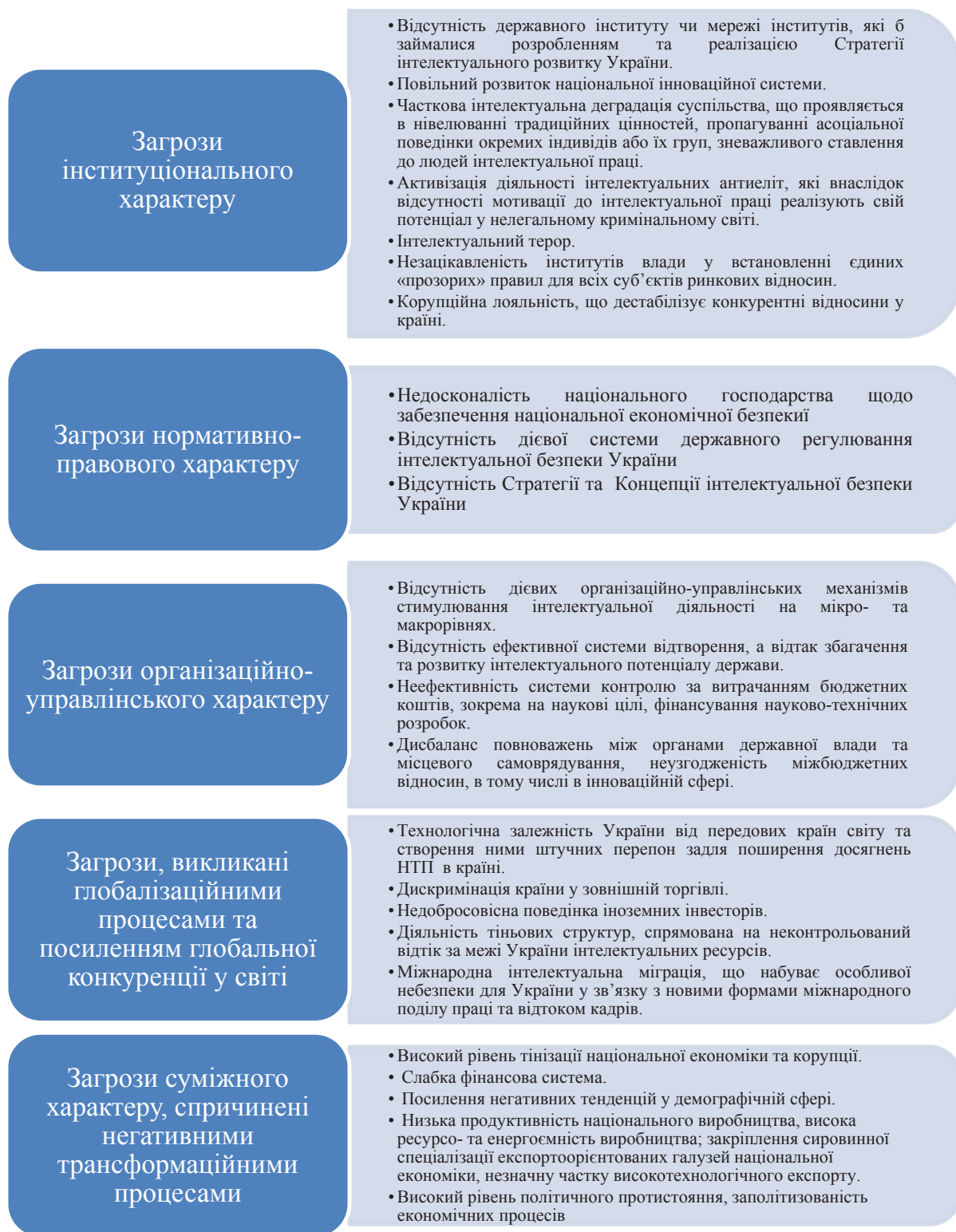
Рис. 2. Класифікація загроз інтелектуальній безпеці України