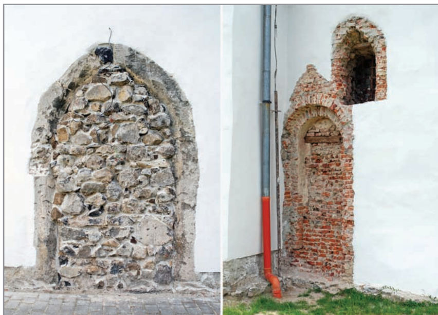
Befalazott portál a hajó északi falában (balra) és a rotunda befalazott kapuja (jobbra)