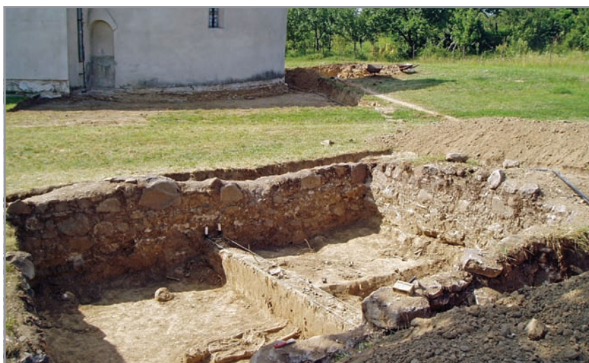
Téglalap alaprajzú épület alapozása a templomtól keletre

Többek között, a rotunda körül eltávolították a talajt a középkori alapozás szintjéig és vízvezető rendszert fektettek le a templom belső freskóit súlyosan veszélyeztető talajvíz elvezetésére.