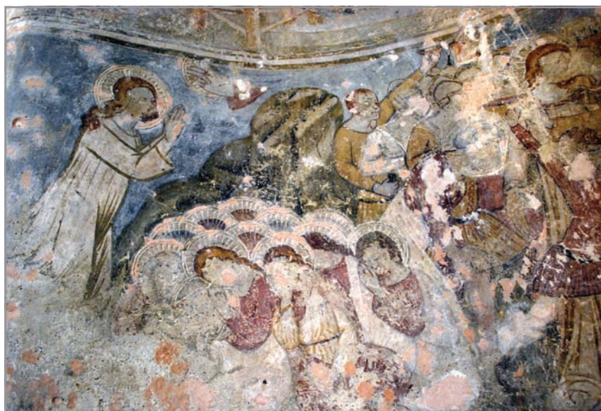
A rotunda kifestése. „Az olajfák hegyén”