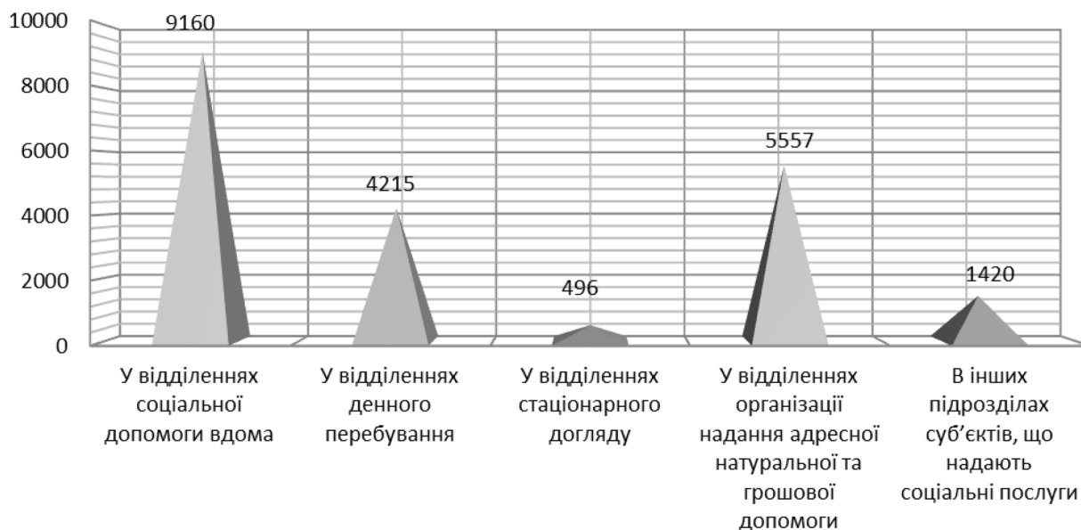
Рис. 3. Соціальні послуги залежно від місця надання.

Найбільшою популярністю користуються відділення соціальної допомоги вдома (рис. 3). Варто звернути увагу, що 79,4 відсотків отримувачів цієї послуги проживають у сільській місцевості. Такий показник не дивує, оскільки 63 відсотки населення Закарпаття проживає у сільській місцевості. Проте, це може бути непрямим свідченням послаблення сімейних зв'язків. В умовах адміністративної реформи ця категорія осіб вимагатиме нових рішень на рівні ОТГ.