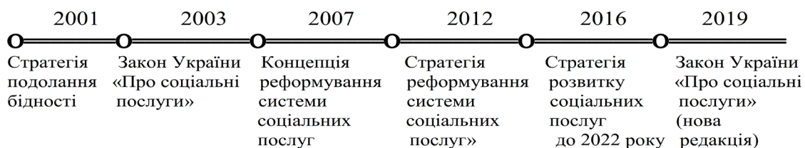
Рис. 1. Ключові етапи реформування системи соціальних послуг в Україні.

Дані хронологічної шкали (рис.1) вказують, що ті чи інші зміни до програмних документів щодо надання соціальних послуг населенню вносяться кожні 3-4 роки. Такий процес зумовлює нестабільність цієї сфери, створює ситуацію невизначеності як для отримувачів, так і для надавачів соціальних послуг різного підпорядкування та форм власності.