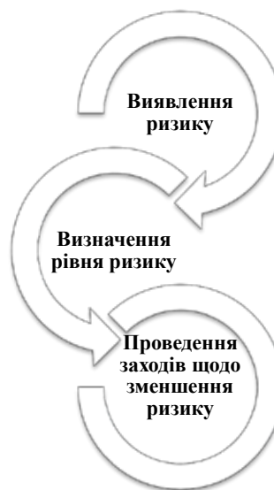
Рис. 2. Ключові принципи наглядової моделі банківського нагляду

Банківський нагляд спирається на наглядову модель, що містить ключові принципи (рис. 2). Головним завданням банківського нагляду НБУ є створення ефективної системи захисту інтересів кредиторів і вкладників банку, оперативного реагування на події, які дестабілізують діяльність банку. Найважливіша місія цієї структури – захистити діяльність банків від фатальних ризиків і захистити інтереси вкладників [3, с. 53].