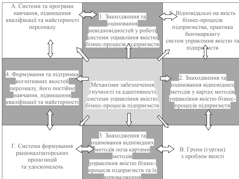
Рис. 2. Місце та роль карт методів управління якістю бізнес-процесів підприємств у механізмах забезпечення гнучкості та адаптивності системи управління якістю

Бізнес-процес на підприємстві найчастіше визначають як модель типу «вхід – перетворення – вихід» (рис. 3).