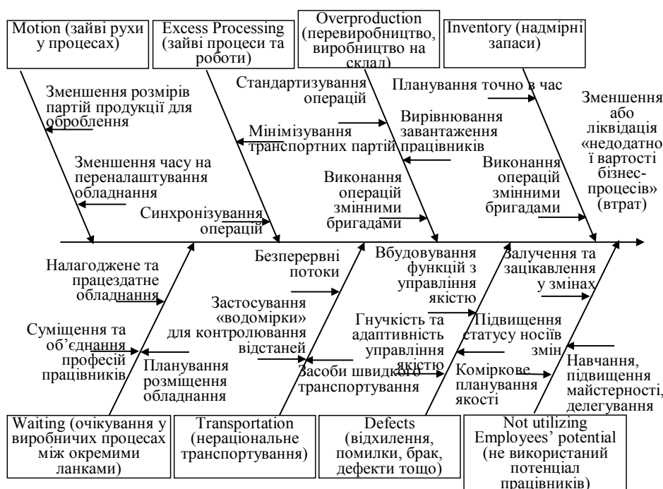
Рис. 4. Факторно-наслідкова модель зменшення втрат (недоданої вартості) в системі управління якістю бізнес-процесів підприємства