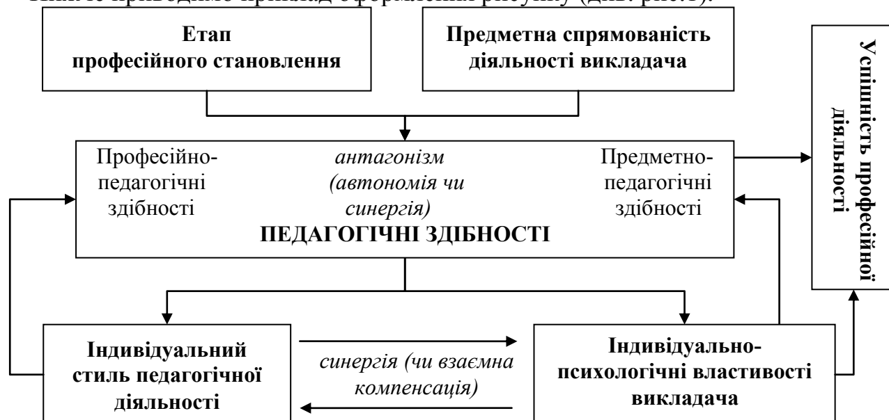
Рис. 1. Структурно-функціональна модель розвитку педагогічних здібностей викладачів ВНЗ (згідно Матвійчук Т.В.).

Нижче приводимо приклад оформлення рисунку (див. рис.1).