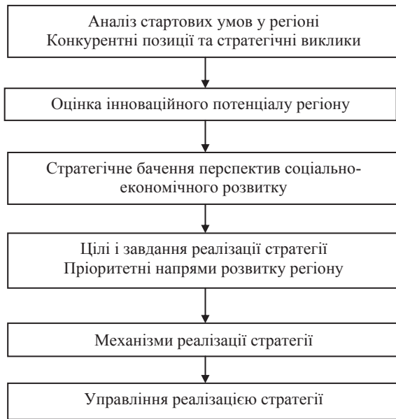
Рис. 2. Структура інноваційної стратегії регіону

Джерело: сформовано автором за джерелом [5, с. 72]