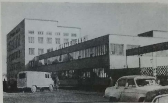
Общий вид Ильницкого опытного завода механического сварочного оборудования. 1980 г.

За период деятельности Народного комитета в Ильнице произошли изменения в быте и культурной жизни села. В марте 1945 г. создана потребительская кооперация, открывшая в селе свои магазины. Медицинскую помощь жители Ильницы могли получить в фельдшерско-акушерском пункте (3 медработника, в т. ч. 1 врач). В селе действовали 3 начальные школы (14 учителей и 359 учеников), преподавание в кото-