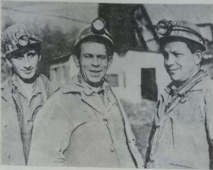
Передовики проходческой бригады шахты «Ильницька», 1980 г.

населения Ильницы проводили 2 клуба и библиотека. В селе действовали отделение связи, детские ясли и сад.