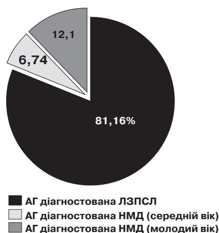
Мал. 3. Структура місця виявлення АГ у населення працездатного віку Дарницького району

Результаты. Результаты ретроспективного анализа выездов ЭМП