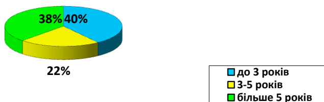
Рис. 2. Структура порушень вуглеводного обміну у хворих на хронічний панкреатит

менша кількість ПВО в післяопераційному періоді, ніж у хворих з анамнезом понад 1 рік (p=0,02). Тому нами запропоновано політику ранньої хірургічної інтервенції – до розвитку незворотних функціональних порушень, які призводять до ендокринної або екзокринної недостатності.