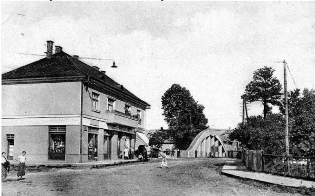
Рис. 2. Іршава 1940 рік. Вулиця Масарика [1]

25 жовтня 1944 року Іршава була визволена від фашистських окупантів. У листопаді 1944 року жителі Іршави одностайно висловились за возз'єднання Закарпаття з Радянською Україною.