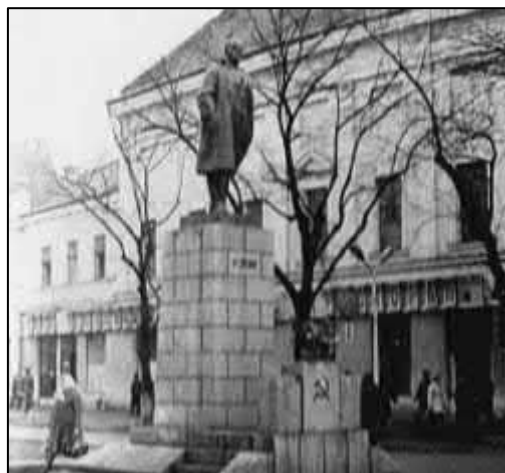
Рис. 9. Скульптура Леніна в Мукачеві, яку спершу встановили на постаменті з-під демонтованого пам'ятника Сталіну.