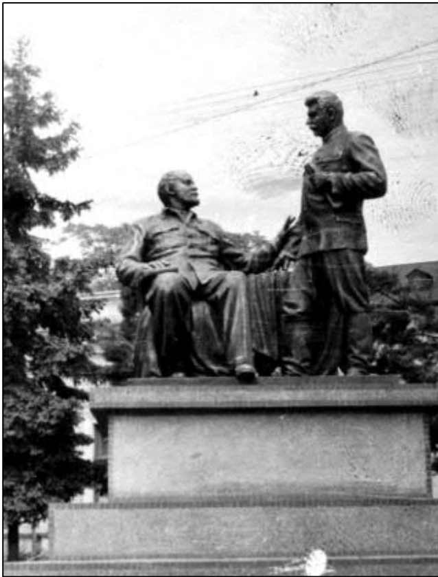
Рис. 5. Ленін і Сталін у Виноградіві. ДАЗО. ф. 3933, оп. 1, шифр О-41692, № 250