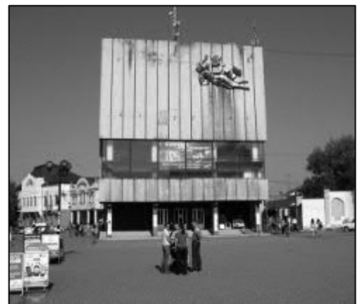
Рис. 16. Вигляд синагоги в м. Берегові на поч. XX ст. Фото невідомого автора з