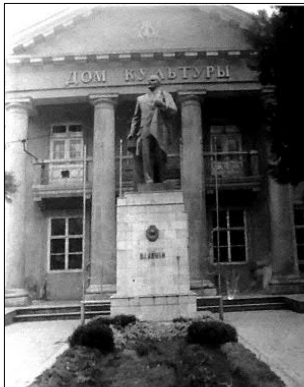
Рис 4. Скульптура Леніна з м. Рахів. Встановлена в 1956 р.