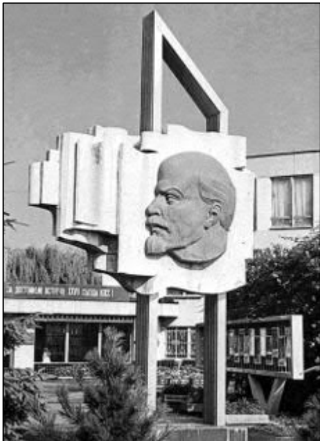
Рис. 19. Барельєф Леніна біля заводу «Ужгородприлад». Архитектурное оформление Ужгорода, 1986. Ужгород: изд-во Карпаты, с. 16.