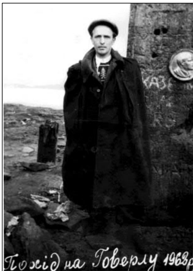
Рис. 10. Барельєф Леніна на г. Говерла.