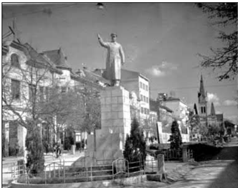
Рис. 8. Пам'ятник Сталіну в м. Мукачево. ДАЗО. ф. 3933, оп. 1, шифр, О-58983, № 273