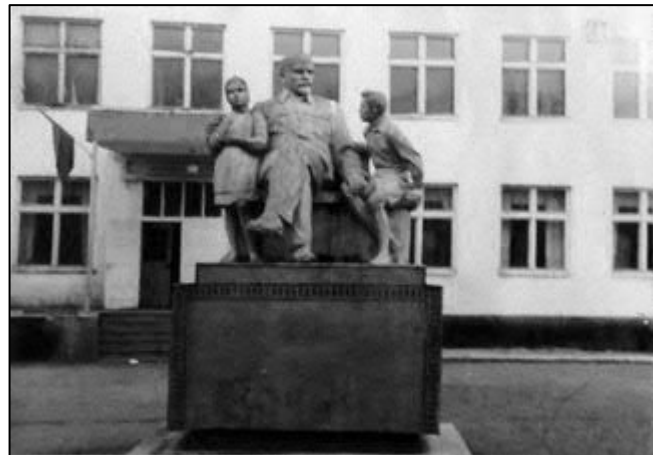
Рис. 20. Пам'ятник «Ленін і діти» у с. Приборжавське (Іршавський р-н).