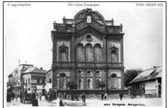
Рис. 15. Первісний вигляд синагоги в м. Берегові.