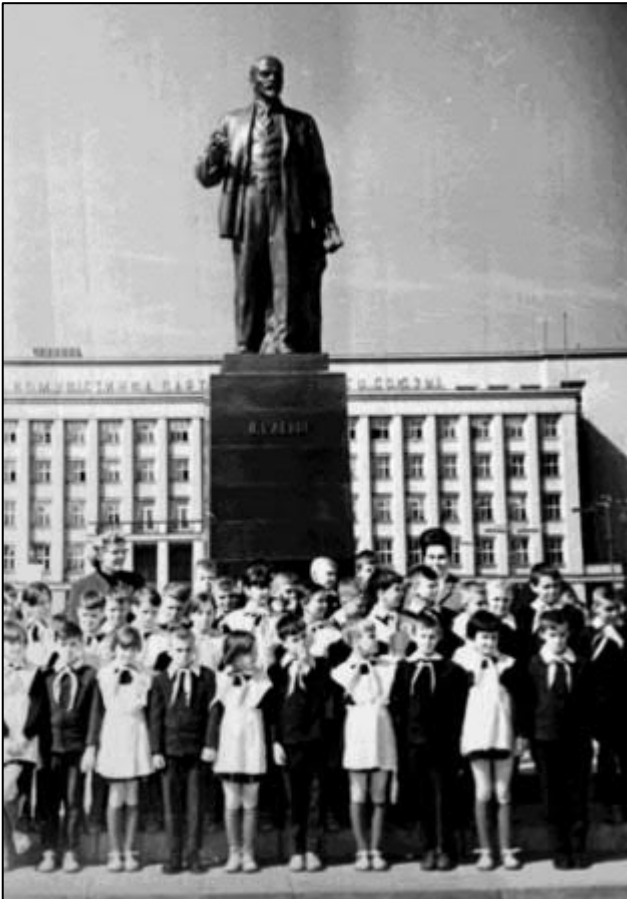
Рис. 12. Біля пам'ятника Леніну в Ужгороді у квітні 1966 року. Од. обл. 0-144697