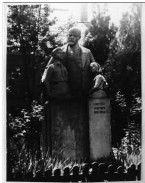
Рис. 21. Пам'ятник «Ленін і діти» у с. Нове Село (Виноградівський р-н). Архів автора