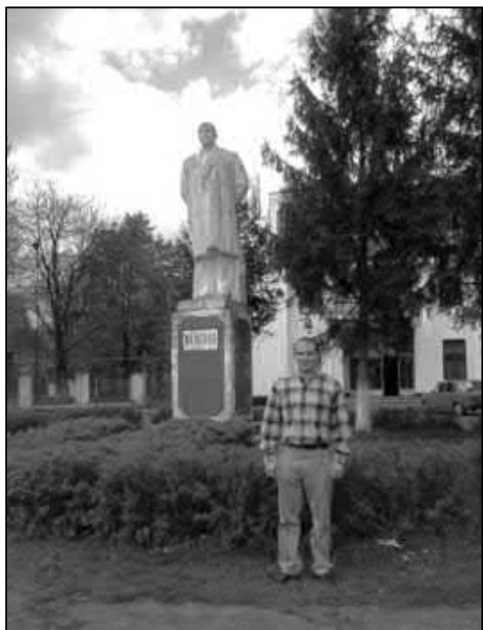
Рис 1. У 2001 році в с. Ільниця (Іршавський р-н.).