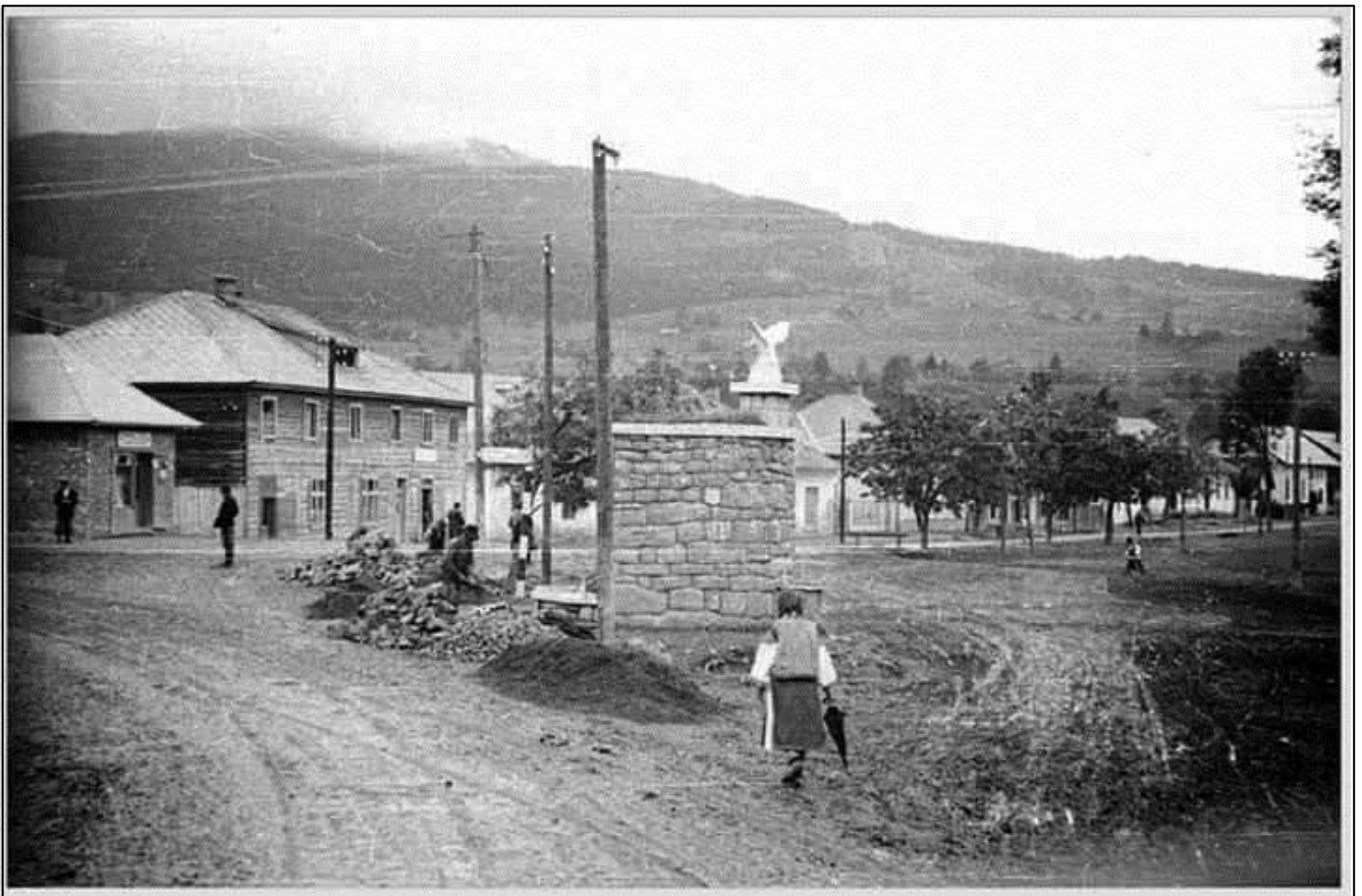
Рис. 6. Пам'ятник турулу в центрі селища Ясіня (Рахівський р-н.). Фото часів Другої світової війни. Архів В. Баккая