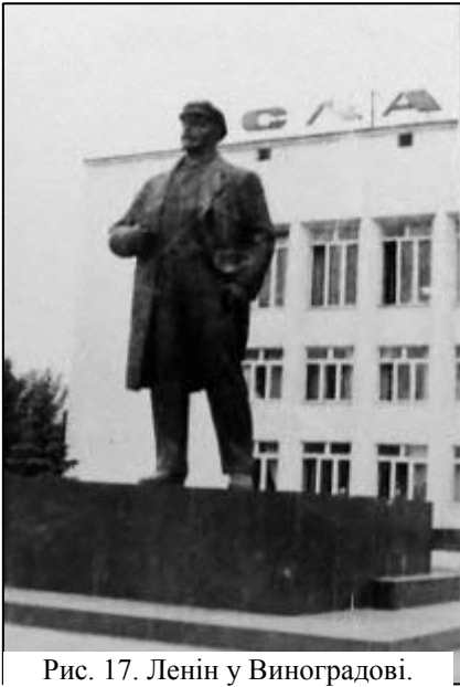
Рис. 17. Ленін у Виноградіві.