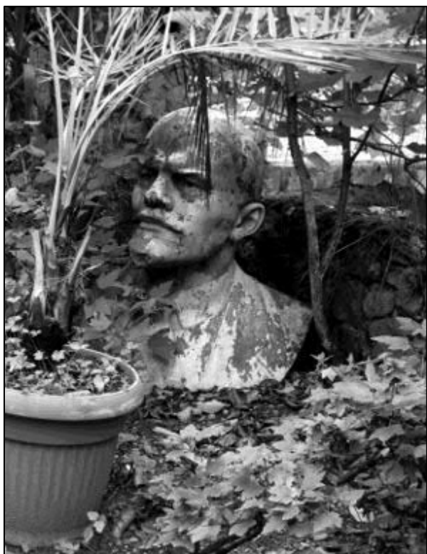
Рис 3. Приватна садиба в м. Рахів.