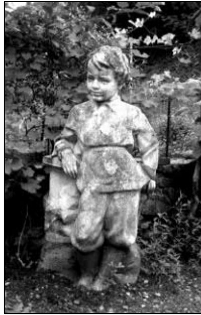
Рис. 18. Приватна садиба в м. Рахів.