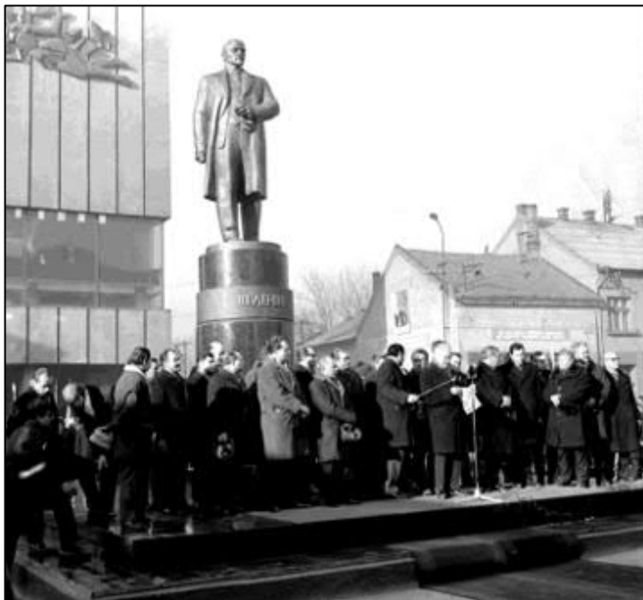
Рис. 14. Відкриття пам'ятника Леніну в Берегові в 1972 р. Центральний державний кінофотофоноархів України імені Г. С. Пшеничного. Од. обл. 2-124578