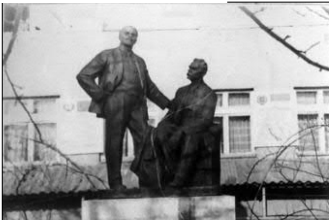
Рис. 22. Пам'ятник «В. І. Ленін і М. Горький» у Сваляві. Архів автора