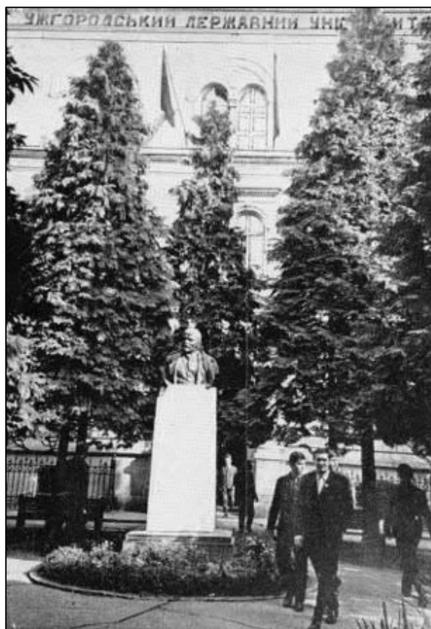
Рис. 11. Бюст Леніна на проспекті Визволення в Ужгороді. Ужгородський державний університет. Довідник, 1970. Ужгород: Вид-во «Карпати», с. 1.